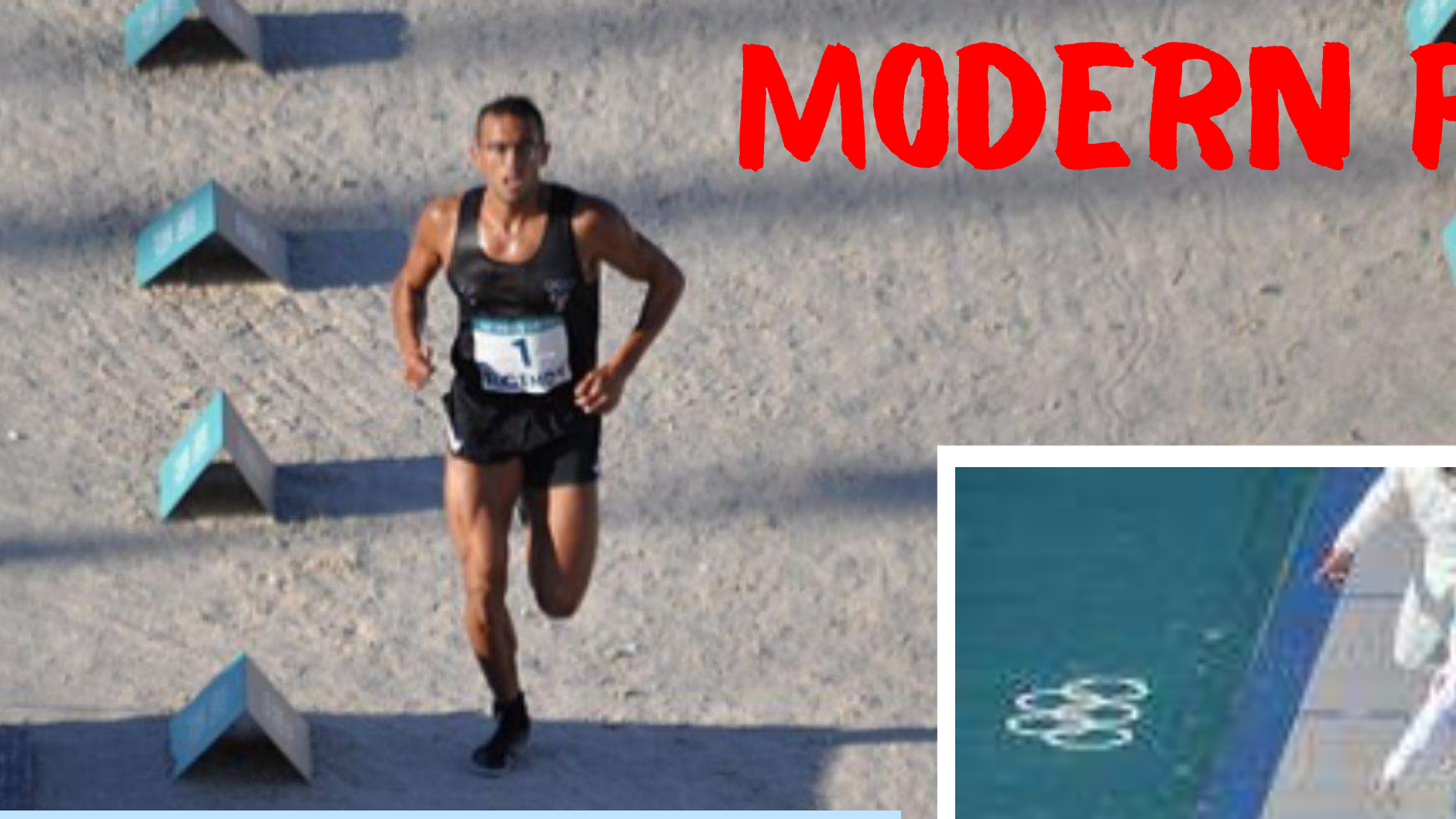
レーザーラン「射撃で5回の的を当て、800mを走る」を4回