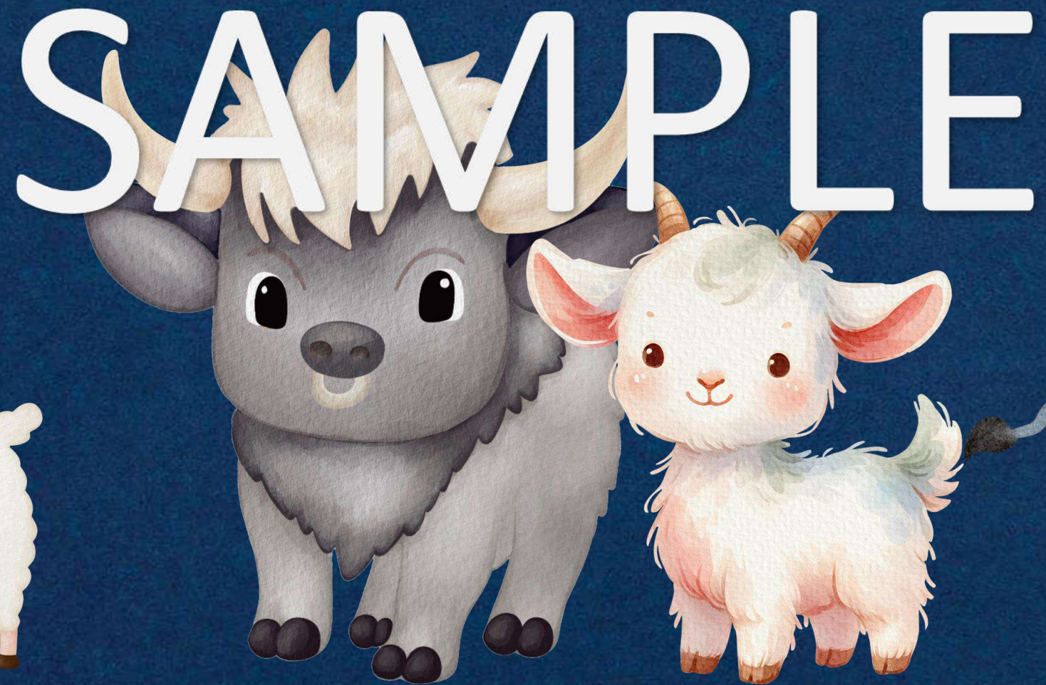
WATER BUFFALO GOAT